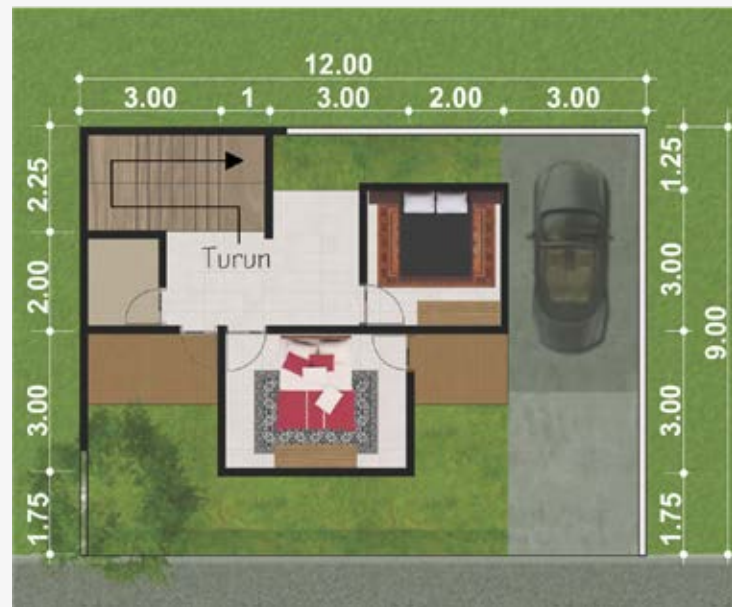
Denah Lantai 2