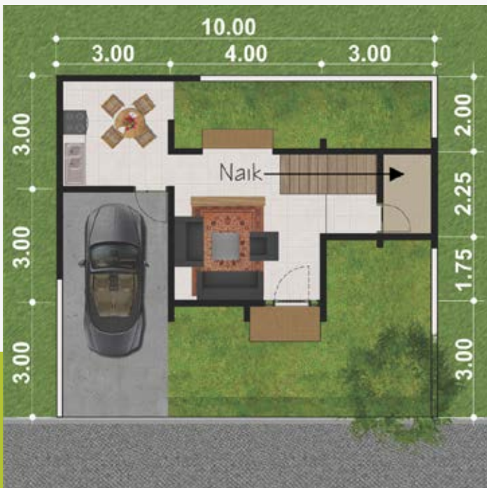
Denah Lantai 1