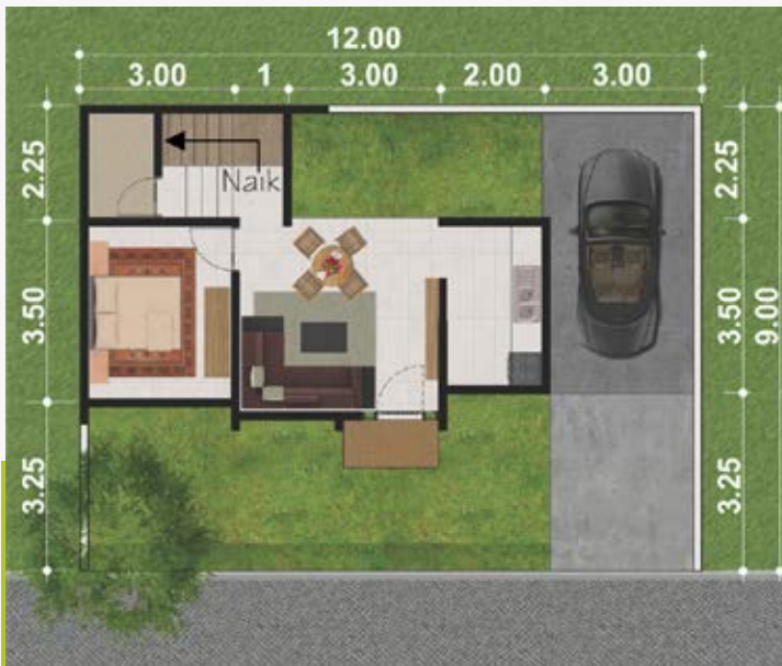
Denah Lantai 1