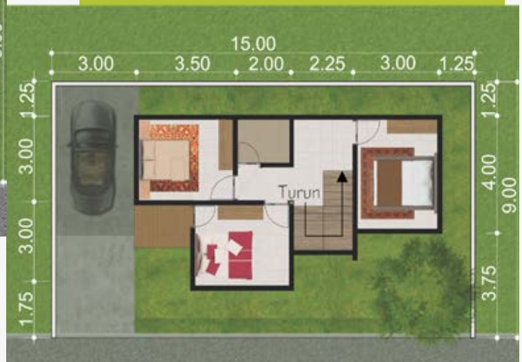
Denah Lantai 2