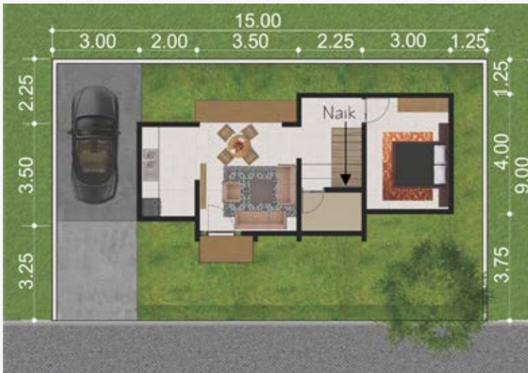
Denah Lantai 1